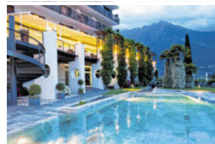
Miramonti Boutique Hotel – alpines Hideaway oberhalb von Meran