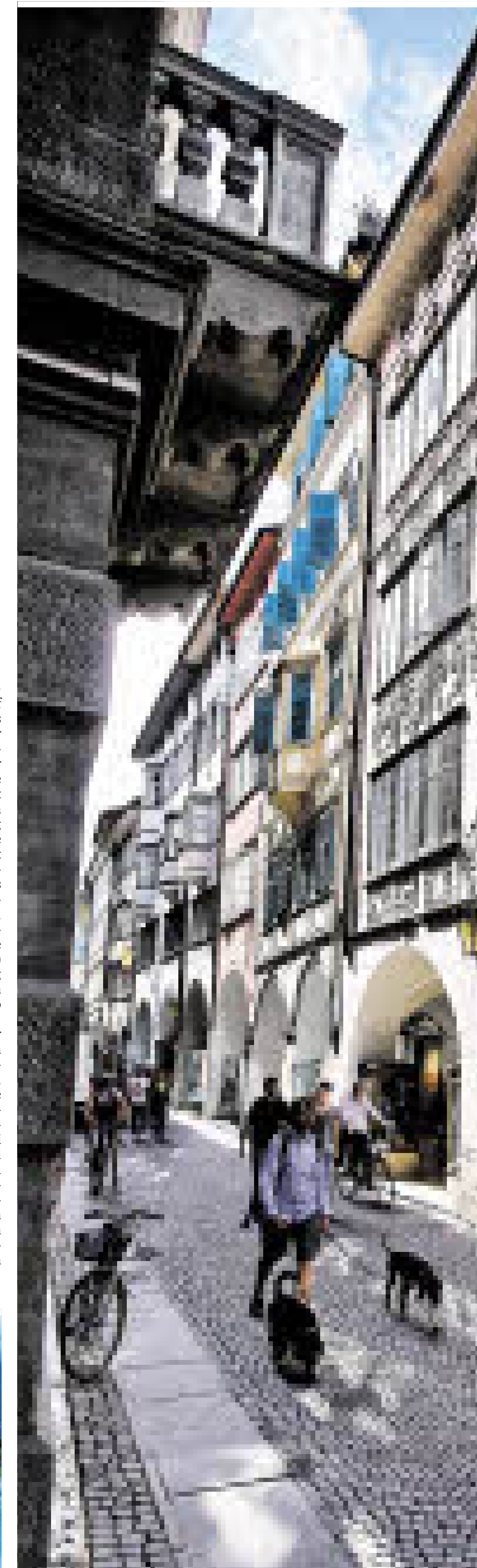
Die Bozner Altstadt lädt zum Bummel in alten Gassen und mittelalterlichen Laubengängen ein